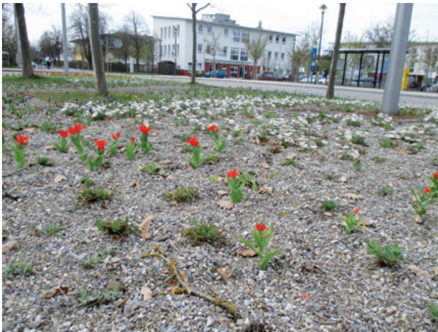
Mittelinsel der Buswendeschleife am Bahnhof Süd - Frühjahrsaspekt mit Blumenzwiebeln