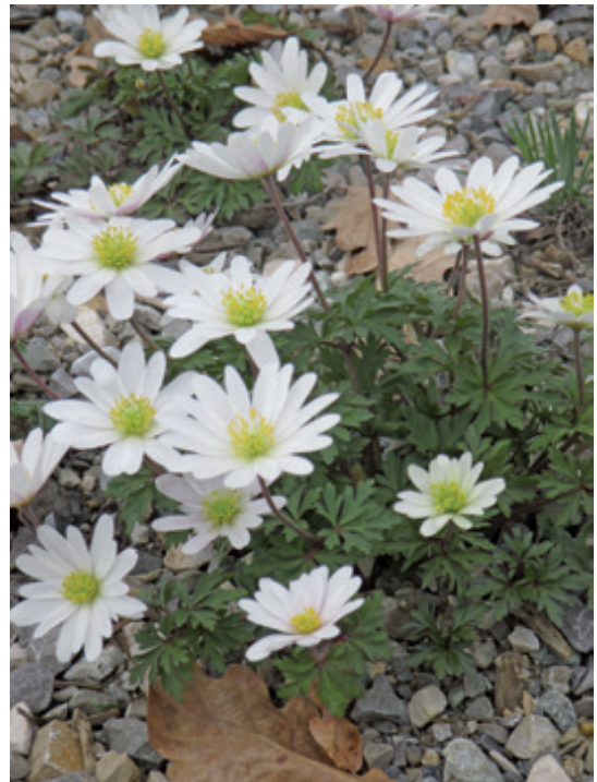
Anemone blanda (Weiße Frühlings-Anemone) auf der Mittelinsel der Buswendeschleife am Bahnhof Süd