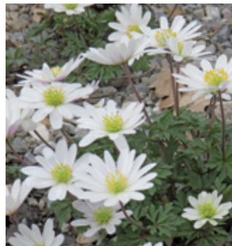
Anemone blanda (Weiße Frühlings-Anemone)

Wie aktuelle Untersuchungen zeigen, hat sich die Anzahl der Insekten in Deutschland in den letzten Jahren drastisch um bis zu 80 % reduziert. Flugfähige Insekten, wie beispielsweise Bienen und Schmetterlinge, übernehmen mit der Bestäubung von Wild- und Nutzpflanzen eine zentrale Bedeutung im Naturhaushalt. Durch die Umgestaltung von Grünflächen und Verkehrsinseln zu Blühflächen kann die Gemeinde Eichenau einen wichtigen Beitrag zum Natur- und Artenschutz leisten. Als erstes Projekt wurde im vergangenen Jahr die Mittelinsel am Bahnhof entsiegelt und nach naturschutzfachlichen Gesichtspunkten umgestaltet. Frau Claudia Müller beschäftigt sich seit vielen Jahren mit der praktischen Umsetzung von naturnahen und insektenfreundlichen Gestaltungskonzepten. An der neu angelegten Blühfläche wird Frau Müller von ihren Erfahrungen berichten und die Bedeutung von naturnahen Bepflanzungen erläutern.