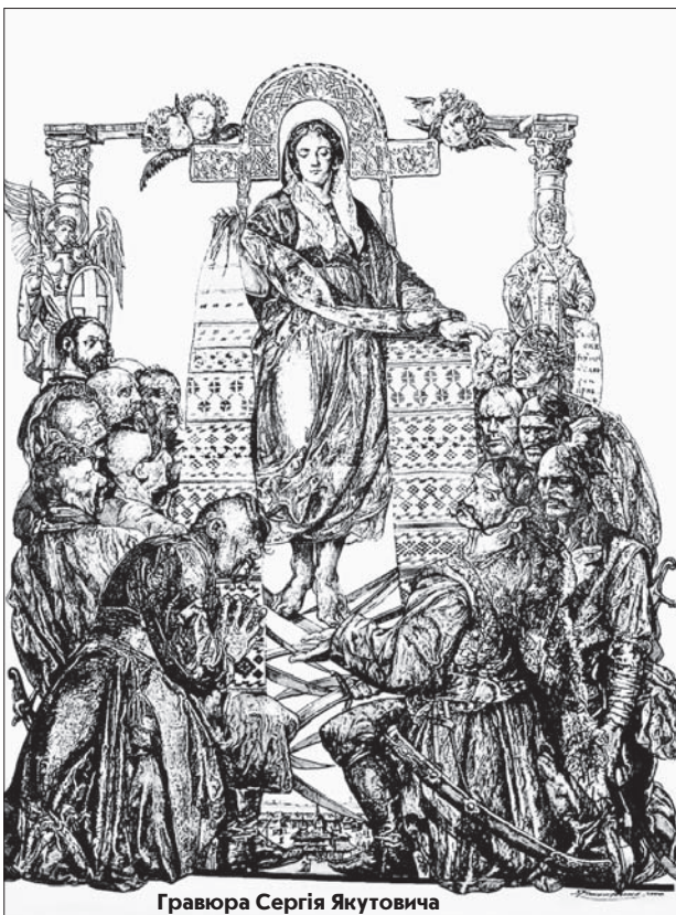
Гравюра Сергія Якутовича

людей, тризубів та інші астральні малюнки, котрі були б нині потрібні для вирішення багатьох деталей історії нашої праукраїнської держави XX тисячоліття до н.е. Проте, що наші предки жили на Землі вже 20 тисяч років тому, доказово говорить доктор філософських наук Валерій Дьомін, який присвятив багато років життя цій унікальній цивілізації. Вона володіла знаннями в області високих технологій і навіть літакобудування, при допомозі яких, використо-