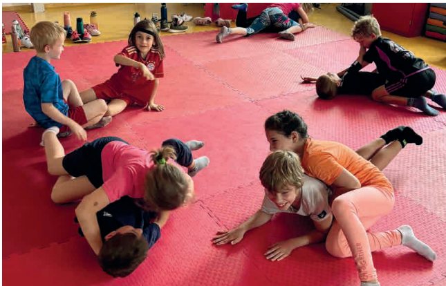
Schülerinnen und Schüler der Klasse 2b der Josef-Dering-Grundschule beim fairen Rangeln.

In dem Projekt „Mattenpädagogik“ durften die Kinder unter Aufsicht von erfahrenen Mattenpädagogen (ausgebildete Pädagogen und Brazilian Jiu-Jitsu-Trainer) Rangeln und Raufen – mit Grenzen und festen Regeln. Denn „faires Raufen“ bietet beste Voraussetzungen für eine optimale körperliche und geistige Entwicklung. Zudem schafft das Training auf der Matte Verbundenheit und Respekt innerhalb der Klasse. So wurde gleichzeitig die Klassengemeinschaft gestärkt. Die Kinder waren sich am Ende einig: Sie hatten alle viel Spaß zusammen und das Projekt war ein voller Erfolg.