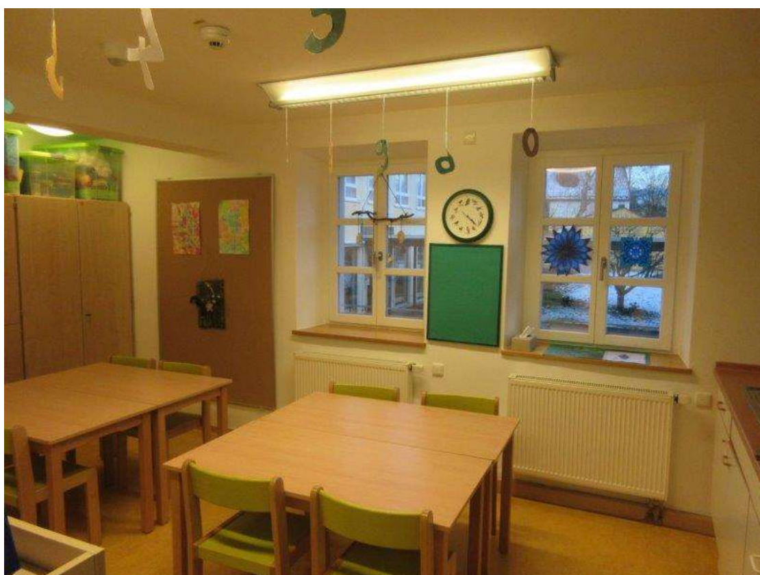
Gruppenraum – Grüne Gruppe