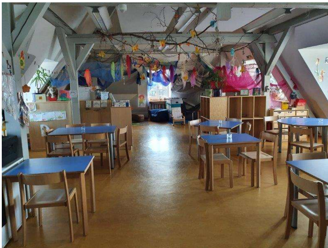
Gruppenraum - Gelbe Gruppe

Alle Hortgruppen nutzen den eigenen Außenbereich mit Schaukel und Sandkasten und den Schulvorplatz als Spielbereich sowie die Turnhalle und den Schulhof mit Fußballplatz.