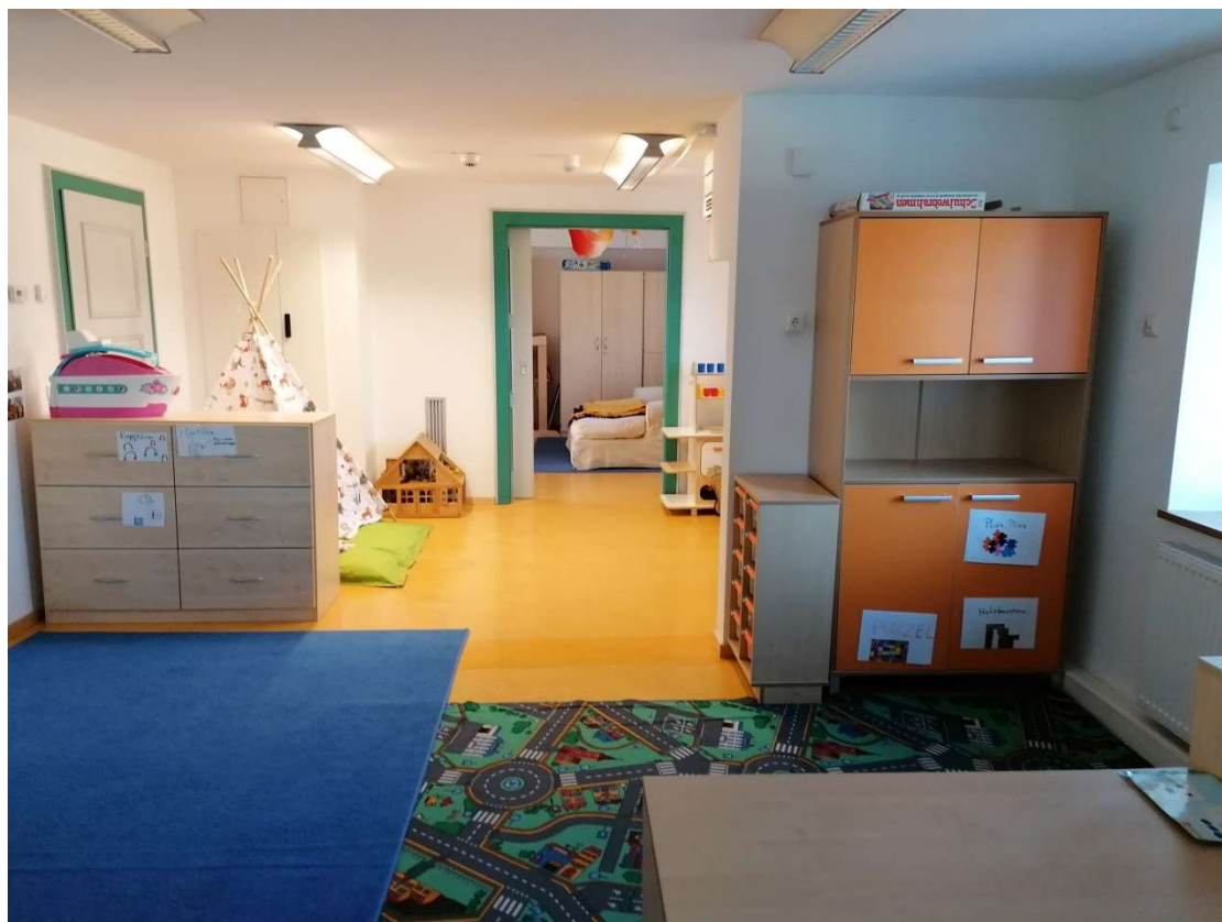
Bastelzimmer – Orangene Gruppe